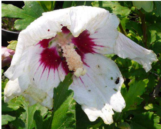
Abbildung 2: Der Flohkäfer frisst kleine Löcher in die Blütenblätter.

Zierpflanzen. Die Eier und Larven von L. xanthodera können leicht mit kleinen Erdklumpen an den Wurzelballen verschleppt werden. Durch ihr breites Nahrungsspektrum finden die Käfer bei uns - erst recht in Gartencentern - reichlich Nahrung. Von den Gartencentern werden sie dann in Europa weiter verbreitet. Auch das Vorkommen in Maxglan lässt sich auf diese Weise leicht erklären. M. Bernhard bezog Pflanzen von einem niederländischen Großhändler.