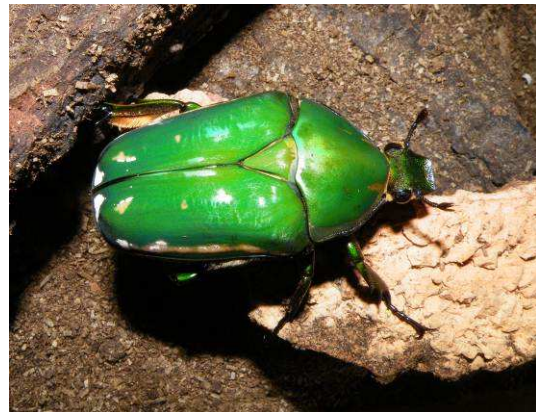
Abbildung 6: Mecynorrhina torquata immaculicollis Weibchen

sie Banane. Die Zugabe von sogenanntem „Bettle Jelly“ ist eine gute Nahrungsergänzung.