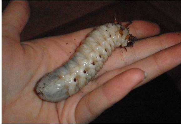
Abbildung 8: L3-Larve Mecynorrhina torquata immaculicollis

Die Larven wachsen anfangs recht schnell und verbringen die längste Zeit im L3-Stadium. Sie können zusammen in einer Box gehalten werden, nur bei zu wenig Platz und Futter kann Kannibalismus vorkommen. Je kühler (unter 20 Grad) die Larven gehalten werden, umso langsamer verläuft ihre Entwicklung.