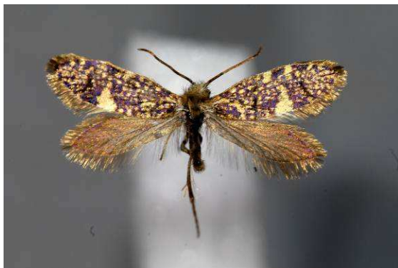
Abbildung 19: Eriocrania salopiella