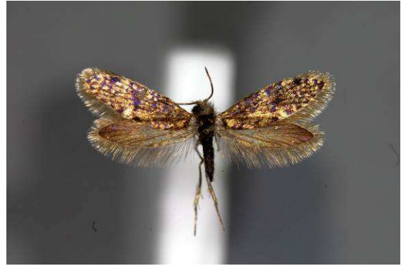
Abbildung 20: Eriocrania cicatricella