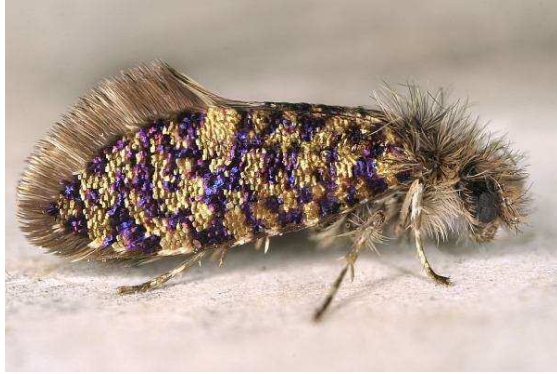
Abbildung 16: Eriocrania sparrmannella - Lebendaufnahme

Somit wurden folgende Arten im Bundesland Oberösterreich wiedergefunden bzw. erstmals nachgewiesen: