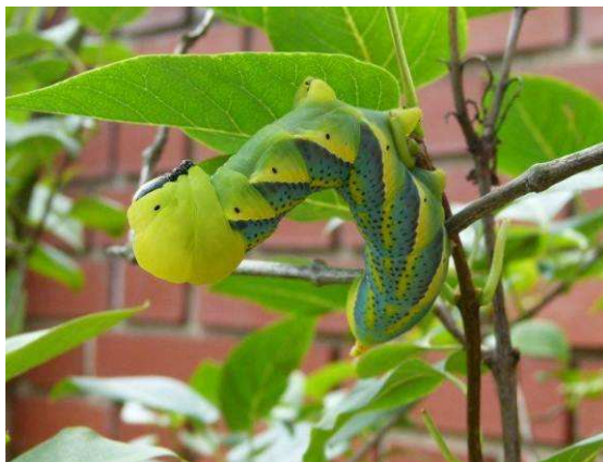
Abbildung 10: Hier die fast 10cm lange Raupe des Totenkopfschwärmers auf dem Flieder der FINDERIN

Am 10.8.2012 wurde in Kaisersdorf (Bezirk Oberpullendorf) eine sehr große Raupe von einer Bekannten entdeckt. Es stellte sich heraus, dass es sich dabei um eine Raupe des Totenkopfschwärmers Acherontia atropos (LINNÉ, 1758) handelte. Sie war