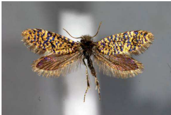
Abbildung 18: Eriocrania sparrmannella