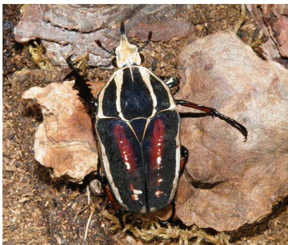
Abbildung 5: Mecynorrhina torquata ugandensis Männchen

Das Terrarium sollte mit Rindenstücken und Ästen bestückt sein, da die Käfer sehr kletterfreudig sind. Die Käfer benötigen nicht unbedingt eine zusätzliche Wärmequelle, Zimmertemperatur ist ausreichend.