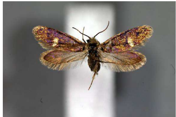
Abbildung 21: Eriocrania unimaculalla