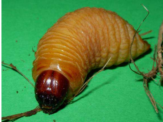
Abbildung 13: Der „Sagowurm“ – Larve des Palmenrüsselkäfer Rhynchophorus ferrugineus .

Inzwischen hat sich der Käfer in ganz Asien ausgebreitet, und tritt in entsprechenden tropischen Ländern als Schädling in Palmenplantagen auf.