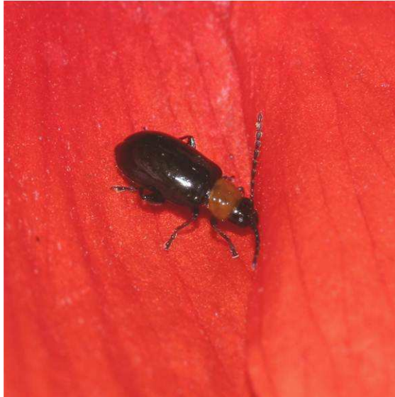
Abbildung 1: Der Flohkäfer Luperomorpha xanthodera (Fairmaire, 1888)

worden war und somit auch in Österreich zu erwarten sei. Von M. Döberl erhielt E. Geiser auch einen Fachartikel (Döberl & Sprick 2009) mit detailliertem Bestimmungsschlüssel, in dem vor allem die Merkmale, mit denen sich L. xanthodera von den nächstverwandten Arten unterscheidet, genau beschrieben waren.