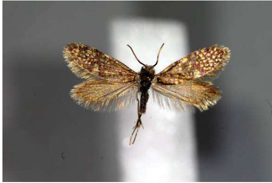
Abbildung 17: Eriocrania cicatricella