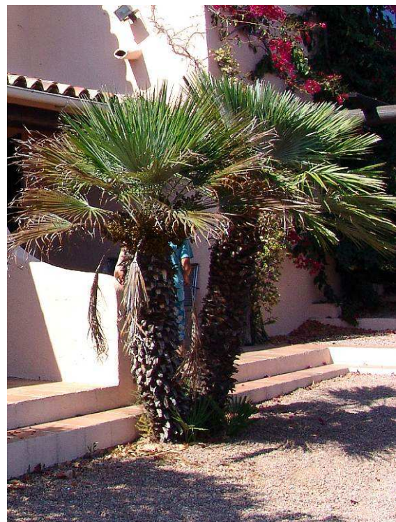
Abbildung 14: Der frische Schnitt der unteren Kronen-Blätter dieser Dattelpalmen der Umgebung von Porto-Vecchio hat Verletzungen hinterlassen, die bald die Sichtung einzelner Palmenrüsselkäfer ermöglichte.

Die Larven leben im Mark der Palmen, und sind in der Lage, den befallenen Baum zum Absterben zu bringen. Wenn der Befall von außen sichtbar wird (Verfärbung der Blätter, später auch welken), ist es für die Palme meistens zu spät. Es wird empfohlen, sie dann zu fällen und zu verbrennen, um den potenziellen Ausbreitungsherd zu zerstören. Zusätzlich zur direkten Zerstörung des Gefäßgewebes durch die Larven können sich anschließend auch Bakterien und Pilze dazugesellen, die das Absterben mitunter auch beschleunigen können.