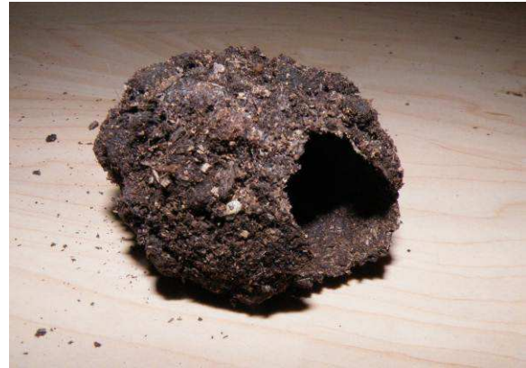
Abbildung 9: Kokon nach dem Schlupf

etwa so groß wie ein Hühnerei und wird mitten ins Substrat, aus eigenem Kot und Substrat, gebaut. Das Substrat sollte dann trocken sein und nach etwa 2, 5 Monaten schlüpft der Käfer.