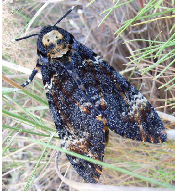
Abbildung 11: Der Totenkopfschwärmer Acherontia atropos mit der auffallenden namensgebenden Zeichnung am Rücken.

Tropen Afrikas liegt und der in Europa nur im äußersten Süden bodenständig ist.