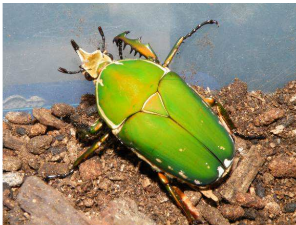
Abbildung 3: Mecynorrhina torquata immaculicollis Männchen

Die Haltung von Wirbellosen wird in der Terraristik immer beliebter und vor allem die Käfer erleben zurzeit einen Aufschwung.