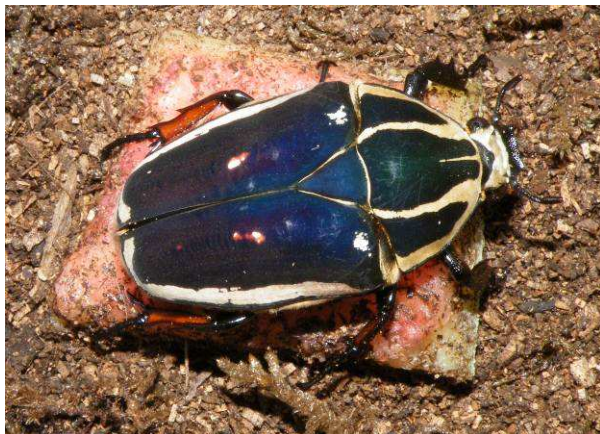
Abbildung 4: Mecynorrhina torquata ugandensis Weibchen

Diese Käferarten haben eine Generationsdauer (vom Ei bis zum Käfer) von etwa einem Jahr. Der Käfer selbst wird bis zu 5 Monate alt. Die Weibchen werden bis zu 60mm, die Männchen werden mit 85mm größer und besitzen ein auffallendes Horn am Kopf. Die Imagos können paarweise oder mit Weibchenüberschuss in einer großen Box oder Terrarium gehalten werden. Wenn man zwei Männchen zusammenhält, führt das oft zu Kämpfen, die auch mit dem Tod des Unterlegenen enden können.