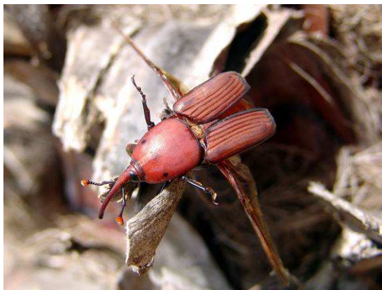
Abbildung 12: Der Palmenrüsselkäfer Rhynchophorus ferrugineus kurz vor dem Abflug in der Umgebung von Porto-Vecchio.

Im Rahmen eines Aufenthalts auf Korsika im letzten Sommer fiel mir in der Umgebung von Porto-Vecchio (Südkorsika) ein auffällig großer (ca. 35 mm Länge), elegant gefärbter Rüsselkäfer auf, der mir auch gleich etwas „exotisch“ vorkam. Im Aussehen erinnerte er mich an die Palmen-