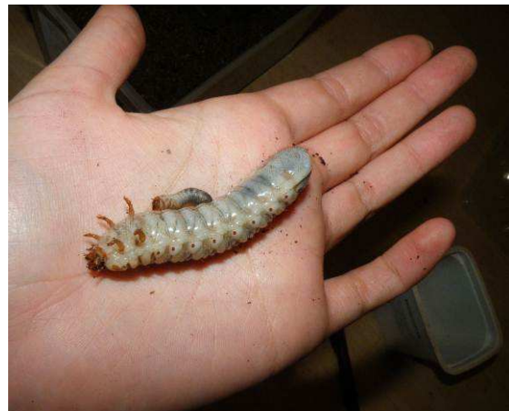
Abbildung 7: L1 und L2-Larve Mecynorrhina torquata ugandensis

Das Substrat sollte mindestens 15 cm hoch sein, dient als Larvenfutter und setzt sich aus Laubwaldhumus und zerkleinertem weißfaulem Holz zusammen. Das Substrat muss alle paar Wochen, je nach Menge an Kotpellets, gewechselt werden. Als Zusatzfutter empfiehlt sich Seidenraupenpulver oder (Katzen-) Trockenfutter.